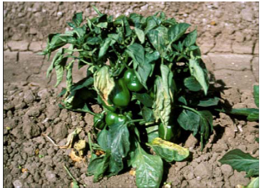
Вертицилиозно венење ( Verticillium dahliae )