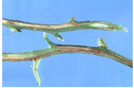
Фузариозно венење ( Fusarium oxysporum )