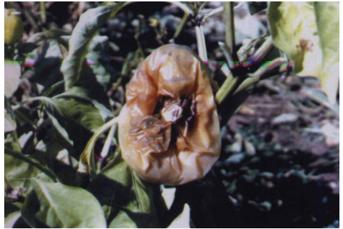
Бактериско влажно гниење на плодовите кај пиперката ( Erwinia carotovora )