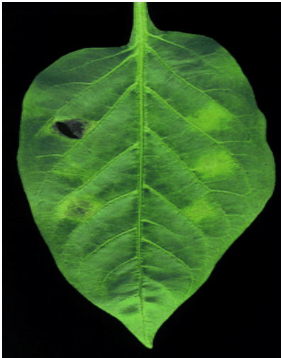
Бактериска дамкавост ( Pseudomonas syringae pv. Syringae )