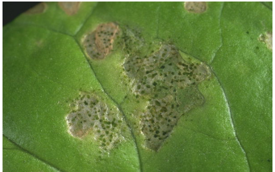
Трипси ( Frankliniella occidentalis )