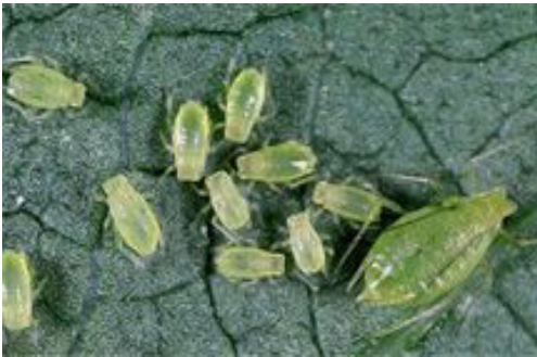
Лисни вошки ( Myzus persicae )