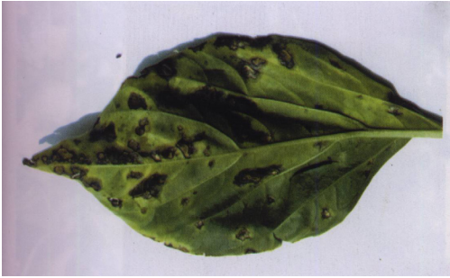
Бактериска дамкавост кај пиперката ( Xanthomonas campestris pv. vesicatoria )